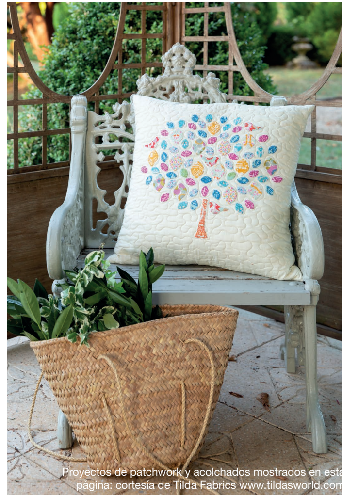
Proyectos de patchwork y acolchados mostrados en esta página