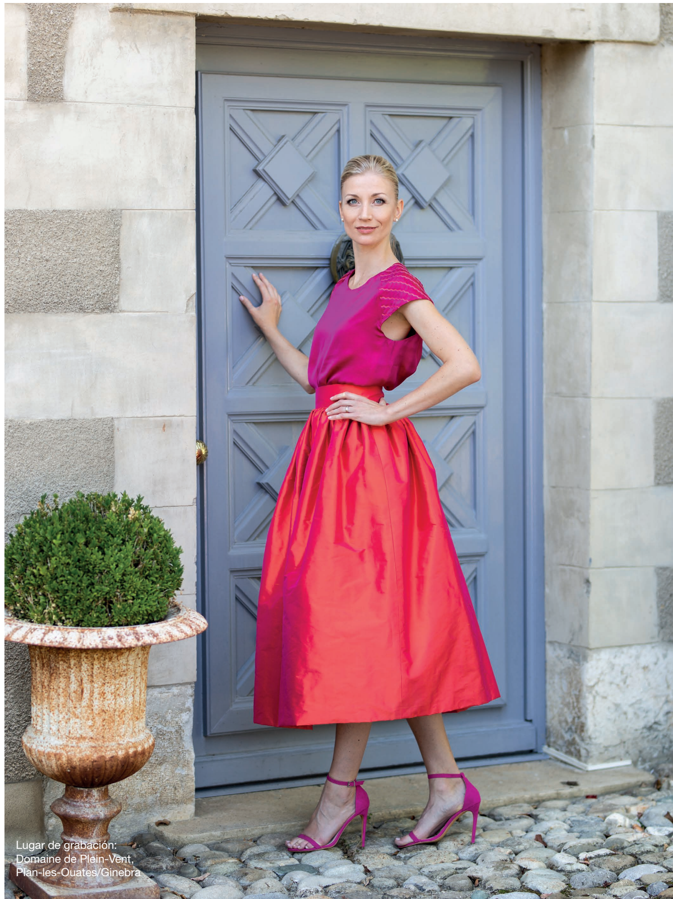
Lugar de grabación: Domaine de Plein-Vent, Plan-les-Ouates/Ginebra