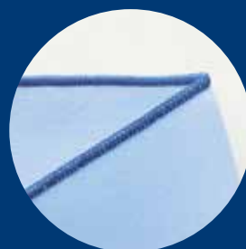
Overlock estrecha 3 hilos

* 2 agujas 2/3/4 hilos con dobladillo enrollado automático y diferencial