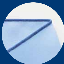
Doblado enrollado 3 hilos